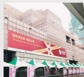
台湾支社 台北市信義路五段五號 台北世貿中心展覽大樓 5樓 5D17 TEL.02-2720-0322